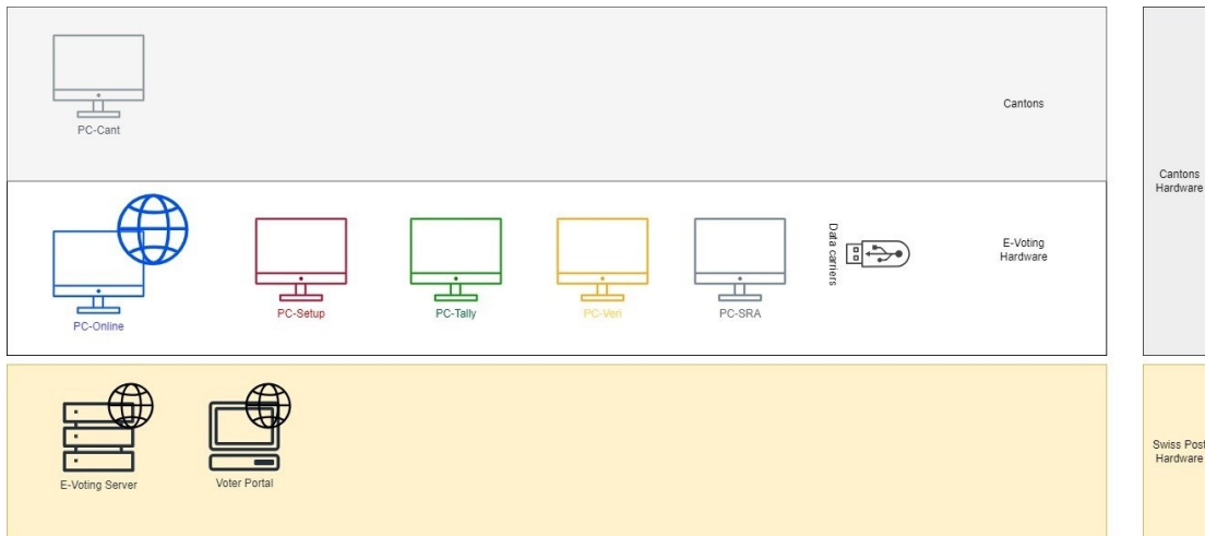
Abbildung 1: Komponenten E-Voting

Das produktive E-Voting System besteht aus den in Abbildung 1 aufgeführten Komponenten (siehe Abschnitt 3.1 ).