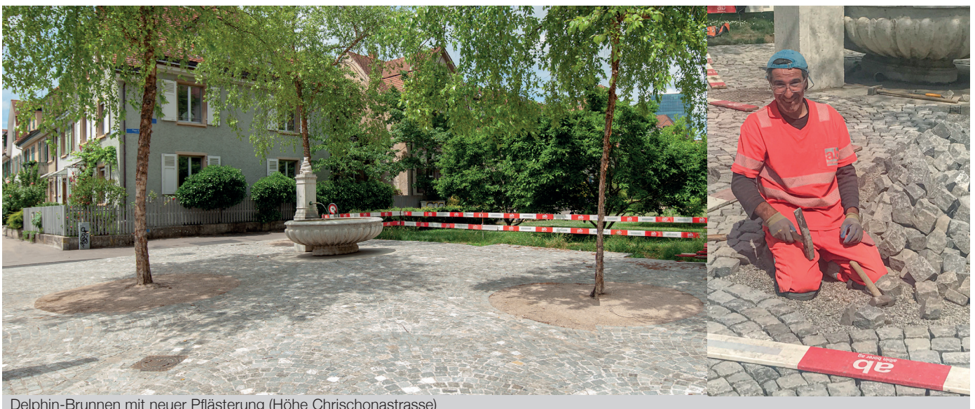
Delphin-Brunnen mit neuer Pflasterung (Höhe Chrischonastrasse)

Neben dem Leitungs- und Strassenbau im Bereich Peter Rot-Strasse/Grenzacherstrasse werden auch die restlichen Belagsarbeiten im Gebiet Chrischonastrasse / Zum Bischofstein ausgeführt. Der Abschluss der Instandstellungsarbeiten westseitig von Roche-Bau 4 sowie die Umgestaltung auf den Vorplätzen der Roche-Bauten 10, 97 und 98 entlang der Wettsteinallee sind für Ende 2022 vorgesehen. Je nach Baufortschritt kann die Stadtgärtnerei bereits Ende dieses Jahres 40 neue Bäume pflanzen.