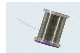
Filo in tungsteno