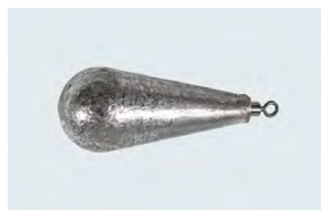
Piombi a pera