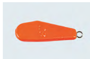
Piombi da traina