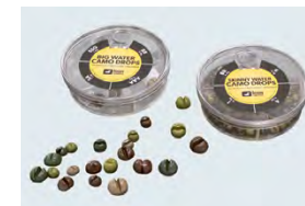
Piombini senza piombo