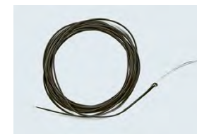
Finale affondante con zavorra in polvere di tungsteno (pesca a mosca)