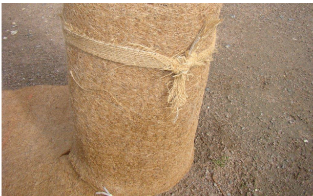
Ausreichend dicke Kokosmatten stellen einen wirksamen Schutz vor Rindenverletzungen dar und mildern leichte Stösse ab.