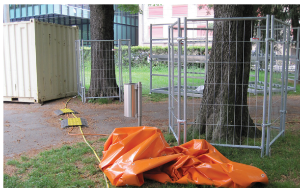
Baumschutzgitter – optimaler Schutz von Stämmen und Wurzelbereichen durch Schaffung von Abstand

gegen den Baum verschoben werden. Allerdings muss dabei sorgfältig vermieden werden, Wurzeln zu verletzen.