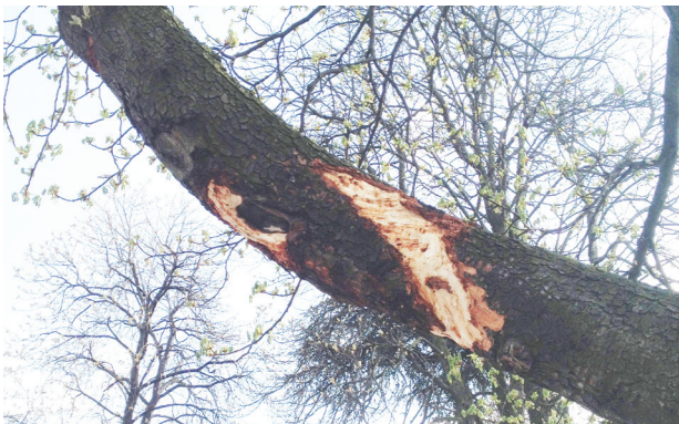
Grossflächige Verletzung eines Hauptastes durch Kollision mit einem LKW während des Aufbaus einer Veranstaltung.

Baumes sind, desto wahrscheinlicher erkrankt er. Auch wenn Äste abbrechen, Rinde am Stamm aufgeschürft bzw. abgerissen wird oder Wurzeln aufgequetscht werden, können Krankheitskeime leichter in den Baumkörper eindringen. Dies passiert beispielsweise durch Anschlagen mit harten, scharfkantigen Gegenständen, auf der Borke scheuernde Leitungen oder das Überfahren des Wurzelbereichs mit Fahrzeugen.