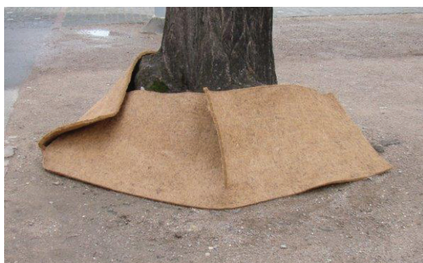
Kokosmatten von mindestens 3 cm Dicke können zur Abdeckung von Wurzelanläufen verwendet werden.