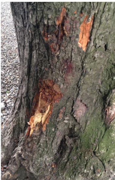
Rindenaufschürfung am Stamm nach Kollision mit einem Gegenstand beim Abtransport.