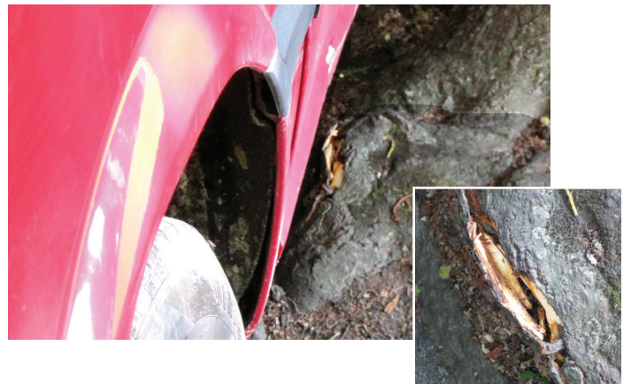
Überfahren von Wurzelanläufen führt zu Quetschungen bis hin zum Aufplatzen der Rinde.

Solche Verletzungen können desweiteren die Leitgefässe und das Kambium eines Baumes lokal zerstören. Auch starker Druck durch das Gewicht von Gegenständen oder stramm um Stamm bzw. Äste gezurrte Seile oder Kabelbinder können dazu führen. Werden Bast und Splintholz beschädigt, so beeinträchtigt dies den Wasser- und Stofftransport im Baum. Bei Verwundung des Kambiums kommt es teils zu gravierenden Wachstumsstörungen.