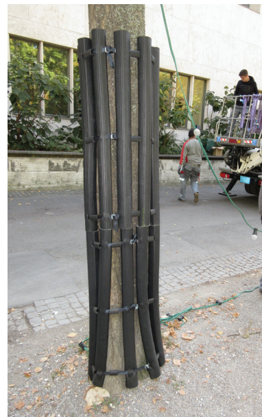
Professioneller Stammschutz der Stadtgärtnerei Basel, im Kofferraum transportabel und leicht zu installieren.