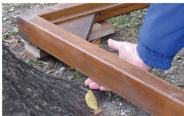
Podestbau für einen Verkaufsstand - Schutz von Wurzelanläufen und gegen Bodenverdichtung durch Abstand.