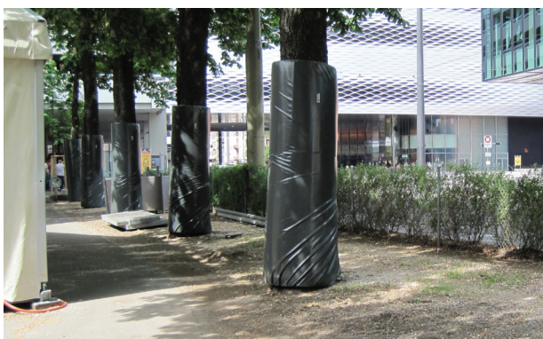
Aufprallschutz aus Schaumgummi – geeignet für lang dauernde Grossveranstaltungen mit umfangreichen Aufbauten und Einsatz grosser Fahrzeuge.