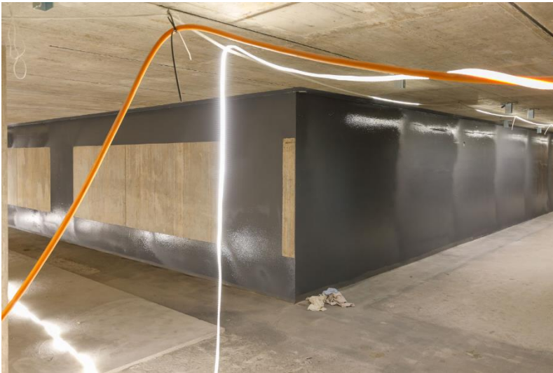
Abb.4: Zusätzliche innere Abdichtung im 5. Untergeschoss (Technik-Teilgeschoss) Foto: Derek Li Wan Po, Oktober 2024