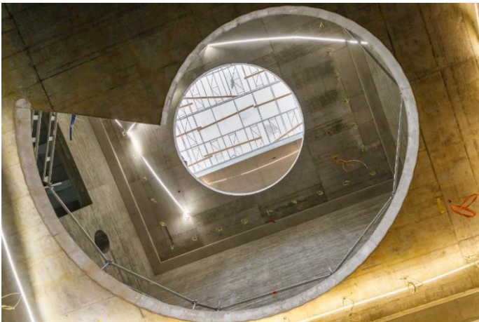
Abb. 5 und Abb. 6 (unten): Vorbereitung der Montage der Wendeltreppen im Haupttreppenhaus des Naturhistorischen Museums Fotos: Derek Li Wan Po, Oktober 2024