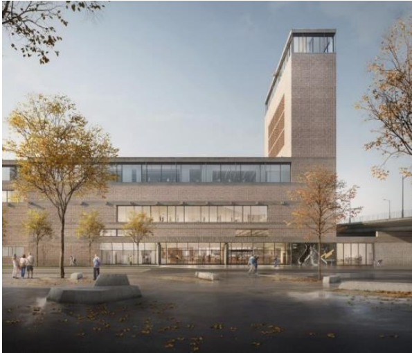
Abb.1: Blick auf den Eingangsbereich vom Vogesenplatz © EM2N & Filippo Bolognese