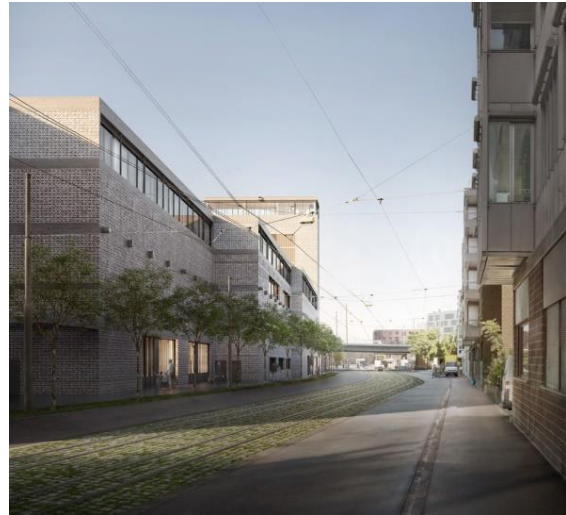
Abb.2: Entenweidstrasse, Blickrichtung Vogesenplatz © EM2N & Filippo Bolognese