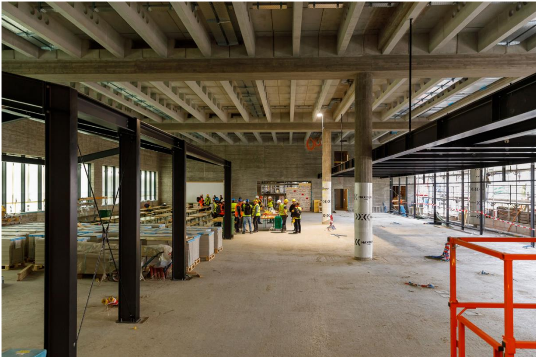
Abb. 3: Rohbau der gemeinsamen Eingangshalle mit Stahlkonstruktion der Empore (rechts) und Unterkonstruktion des Museumshops (links) Foto: Derek Li Wan Po, Oktober 2024