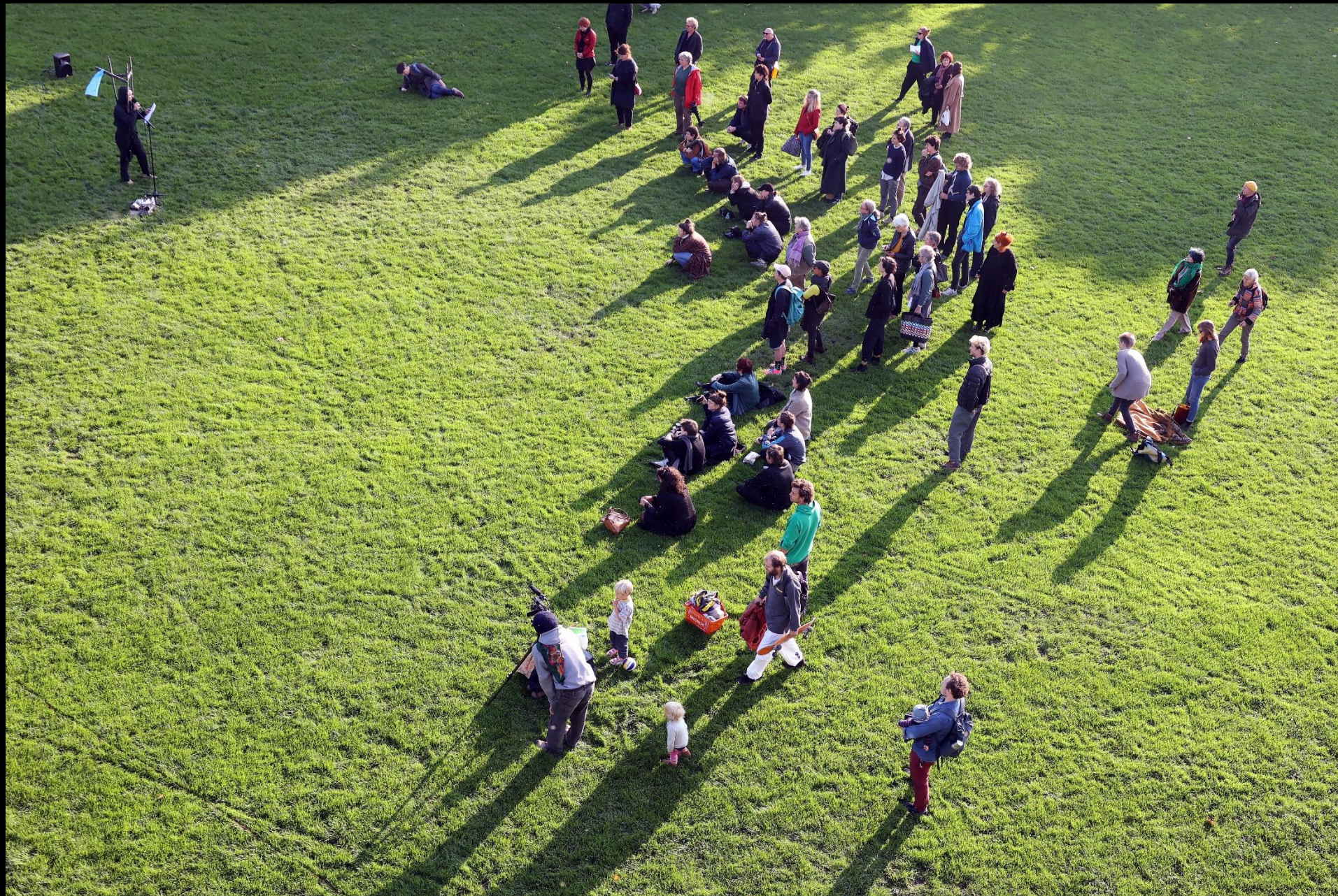
Performance-Projekt «Die Raum», kuratiert von Kadiatou Diallo und Madeleine Amsler, 2021 © Präsidialdepartement Basel-Stadt, Foto: Guillaume Musset