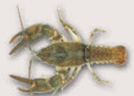
Steinkrebs Austropotamobius torrentium

Naturnahe, strukturreiche, kühle und unverschmutzte Bäche werden als Lebensraum bevorzugt.