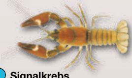
Signalkrebs Pacifastacus leniusculus

Bewohnt Uferzonen stehender und fliessender Gewässer. Ähnelt dem einheimischen Edelkrebs. Stammt ursprünglich von der Westküste Nordamerikas.