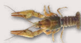
Galizischer Sumpfkrebs Astacus leptodactylus

Bewohnt vorwiegend Seen und Teiche. Erträgt höhere Temperaturen und niedrigere Sauerstoffgehalte des Wassers als die einheimischen Krebse. Wurde als Speisekrebs aus Südosteuropa in die Schweiz importiert.