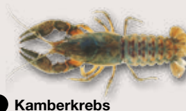
Kamberkrebs Orconectes limosus

Bewohnt Ufer langsam fliessender und stehender Gewässer. Sehr widerstandsfähig gegenüber Umwelteinflüssen. Er lebt auch in verschmutzten und strukturarmen Gewässern. Stammt ursprünglich aus Nordamerika.