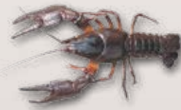
Edelkrebs Astacus astacus

Bewohnt die Uferzonen grösserer Fliessgewässer sowie Weiher und Seen mit gutem Unterschlupfangebot.