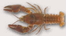
Dohlenkrebs Austropotamobius pallipes

Bewohnt strukturreiche, eher kühle und unverschmutzte Fliessgewässer.