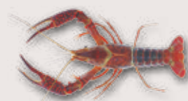
Roter Amerikanischer Sumpfkrebs Procambarus clarkii

Kommt in fliessenden und stehenden Gewässern vor und ist widerstandsfähig gegenüber Umwelteinflüssen. Sein ausgesprochener Wandertrieb führt ihn dazu, auch grössere Distanzen an Land zurückzulegen. Stammt ursprünglich aus dem Süden von Nordamerika.