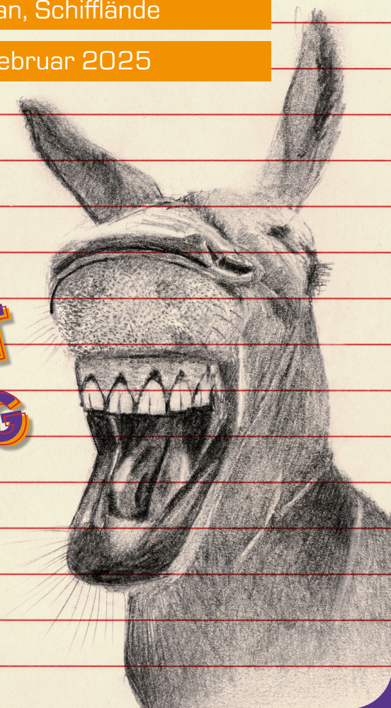
Illustration: Sabine Rufener