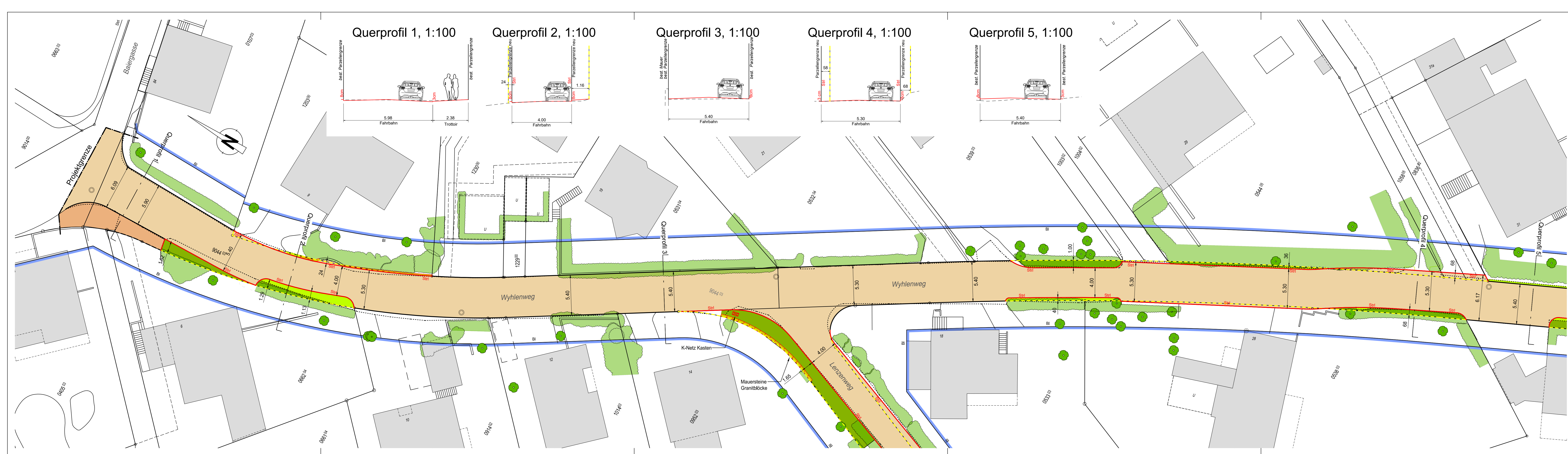
Querprofil 1, 1:100