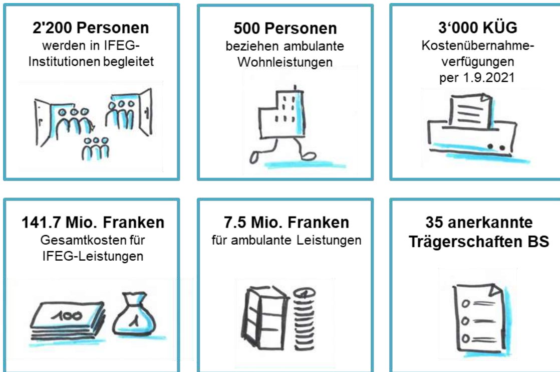
Abb. 4-1: Behindertenhilfe Basel-Stadt 2021 in Zahlen 2