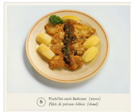
Basel auf dem Teller, Medienbild 5