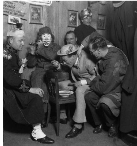
Basel auf dem Teller, Medienbild 4