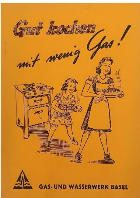
Basel auf dem Teller, Medienbild 3