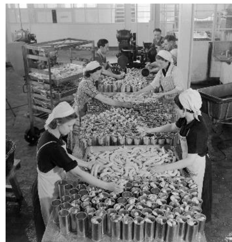
Basel auf dem Teller, Medienbild 10