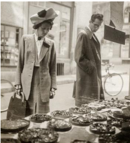
Basel auf dem Teller, Medienbild 2