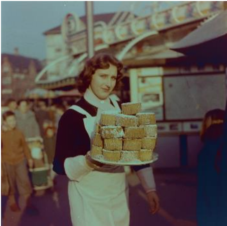
Basel auf dem Teller, Medienbild 1