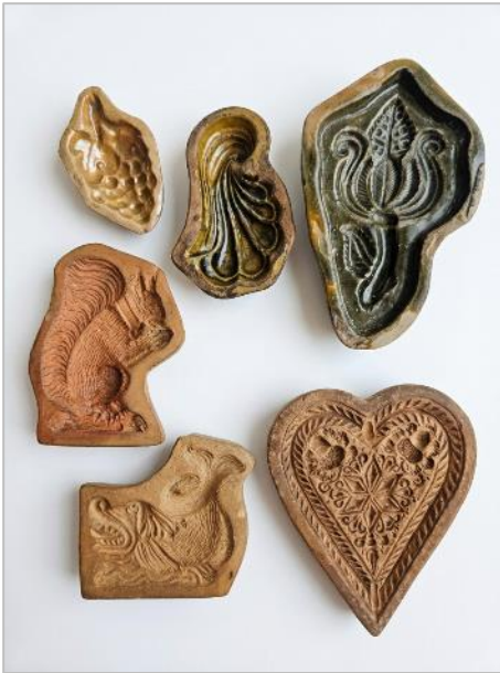
Basel auf dem Teller, Medienbild 7