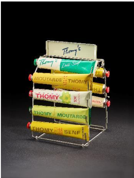
Basel auf dem Teller, Medienbild 8