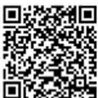
Annarita Vintan-Koger Projektleiterin

Weitere Informationen zum Projekt Clarastrasse finden Sie auf der Webseite des Tiefbauamts www.tiefbauamt.bs.ch/clarastrasse