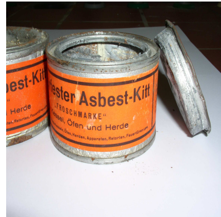
Feuerfester Asbest-Kitt gefunden in einer Privatliegenschaft

In den letzten Jahren hat sich immer mehr gezeigt, dass sich die Asbestproblematik vom öffentlichen auf den privaten Bereich verlagert. Es geht also vermehrt darum, Asbestaltlasten in den eigenen vier Wänden zu erkennen und damit umgehen zu können. Folgende Produkte können asbesthaltig sein, wenn sie vor 1990 hergestellt wurden: Leichtbauplatten in Heizräumen und hinter Elektroinstallationen, Asbestkarton unter Fensterbrettern, PCV-Bodenbeläge ("Novilon"), Rohrisolationen, Akustikplatten und Rohrverkleidungen. Asbesthaltige Produkte stellen dann ein Problem dar, wenn sie mechanisch bearbeitet und dadurch Asbestfasern freigesetzt werden können. Das kantonale Labor bietet deshalb eine kostengünstige, schnelle Analyse und Beratung für betroffene Privatpersonen an.