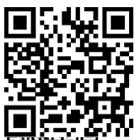
Javier Oliva Projektleiter

Weitere Informationen zum Projekt Hardstrasse finden Sie auf der Webseite des Tiefbauamts www.tiefbauamt.bs.ch/hardstrasse