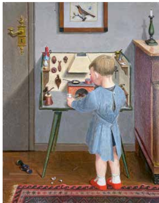
Niklaus Stoecklin, Kind vor Puppenküche , um 1948. Öl auf Hartfaserplatte, 33,5 x 27 cm.

Privatbesitz. © ProLitteris, Zürich. Foto: Niklaus Stoecklin Stiftung, Basel