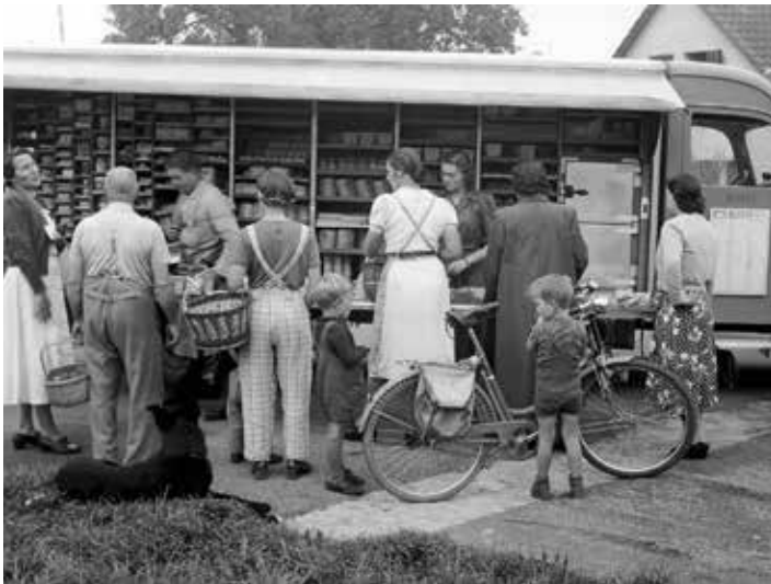
Einkauf beim Migros-Verkaufswagen, um 1935. MGB_Dok_Fo_111763

Im 19. Jahrhundert kauften die Stadtbewohner Frischprodukte grösstenteils im öffentlichen Raum. Daneben gab es in den Erdgeschossen vieler Häuser kleine Läden verschiedener Branchen und Preisklassen. Mit dem Bevölkerungswachstum und den neuen Stadtteilen entstanden Filialgeschäfte wie jene des Allgemeinen Consumvereins Basel (ACV). Ab 1930 brachten die Migros-Verkaufswagen Lebensmittel in die Quartiere. Nach dem Zweiten Weltkrieg verdrängten Selbstbedienungsläden den Verkauf über die Theke und Supermärkte entstanden.