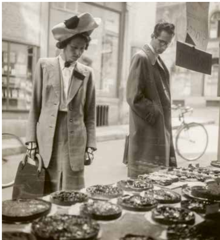
Konditorei Fridolin Winiger, Spalenberg 16, Basel, 1945.

Viele Basler Spezialitäten haben ihren Ursprung im traditionellen Bäckerhandwerk. Besonders während der Herbstmesse und der Basler Fasnacht erfreuen sich diese grosser Beliebtheit. Bis heute produzieren Basler Bäckereien und Confisereien traditionelle Spezialitäten und ergänzen sie mit eigenen Rezepturen und Hauskreationen, die jedem Betrieb ein individuelles Profil verleihen.