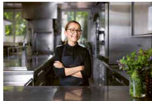
Spitzenköchin Tanja Grandits, Restaurant Stucki in Basel.

Trends wie Veganismus, Lebensmittelrettung oder Rückbesinnung auf regionale Zutaten prägen die Gegenwart ebenso wie internationale Einflüsse. Die Basler Restaurantszene ist vielfältig und bietet von traditionellen Lokalen bis hin zu Gourmettempeln für jeden Geschmack etwas.