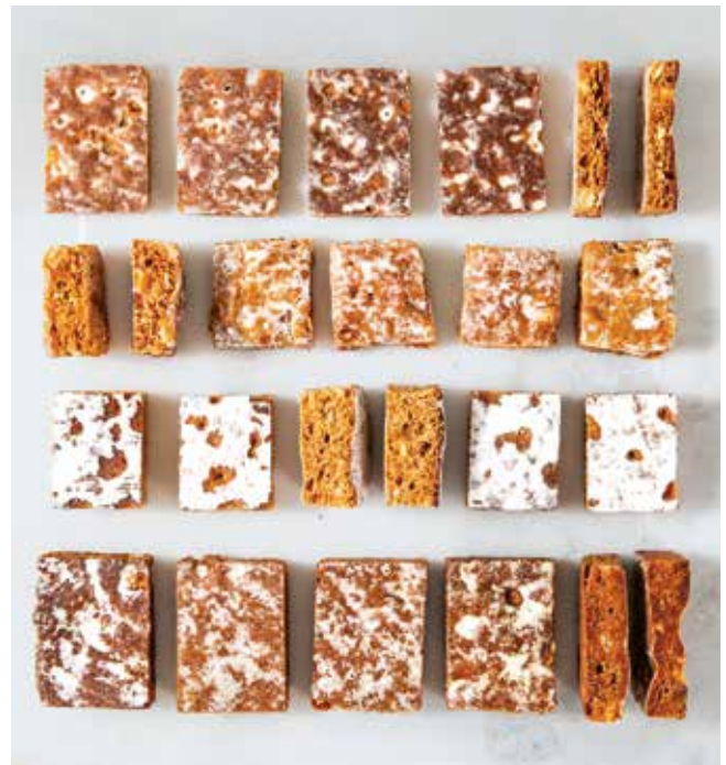
Basler Leckerli von vier verschiedenen Herstellern. Foto: Claudia Schilling, 2026