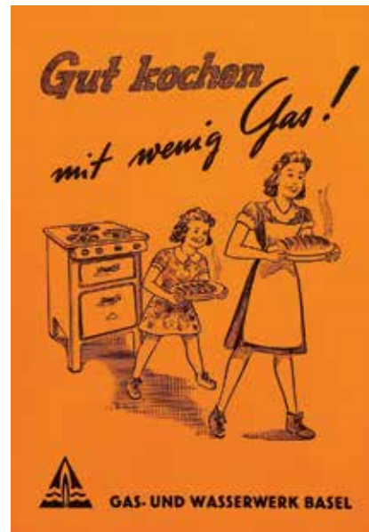
Gut kochen mit wenig Gas! Aus der Reihe Koch- und Backrezepte , hrsg. vom Gas- und Wasserwerk Basel, 1938–1946. Universitätsbibliothek Basel, Pb 36129