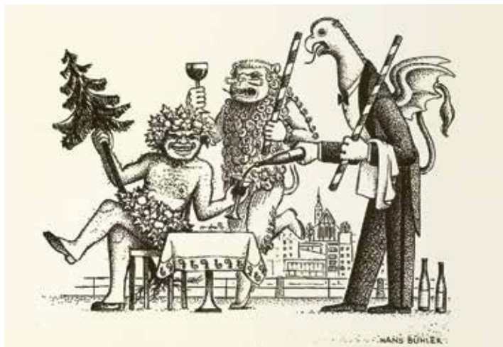
Menükarte für das Gryffe-Mähli, 1968. Die Drei Ehrengesellschaften Kleinbasels. Privatsammlung

Diese Führung wird anlässlich der Sonderausstellung Basel auf dem Teller vom Historischen Museum Basel in Kooperation mit dem Museum Kleines Klingental im Haus zum Kirschgarten angeboten. Informationen und Termine: www.hmb.ch