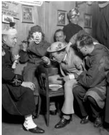
Mann isst Mehlsuppe in einem Lokal während der Basler Fasnacht, um 1930. Foto: Lothar Jeck. Staatsarchiv Basel-Stadt, BSL 1060c 3/1/566