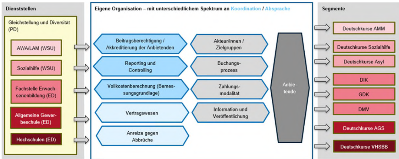
Abbildung 2: Schematische Darstellung der Zusammenarbeit

Hinweise: Blau: Koordination erfolgt auf Basis des vorliegenden Konzepts. Hellblau: Koordination allenfalls künftig (nicht prioritär). Grau: Keine Koordination. Die Anbietenden sind als separates Element zu betrachten.