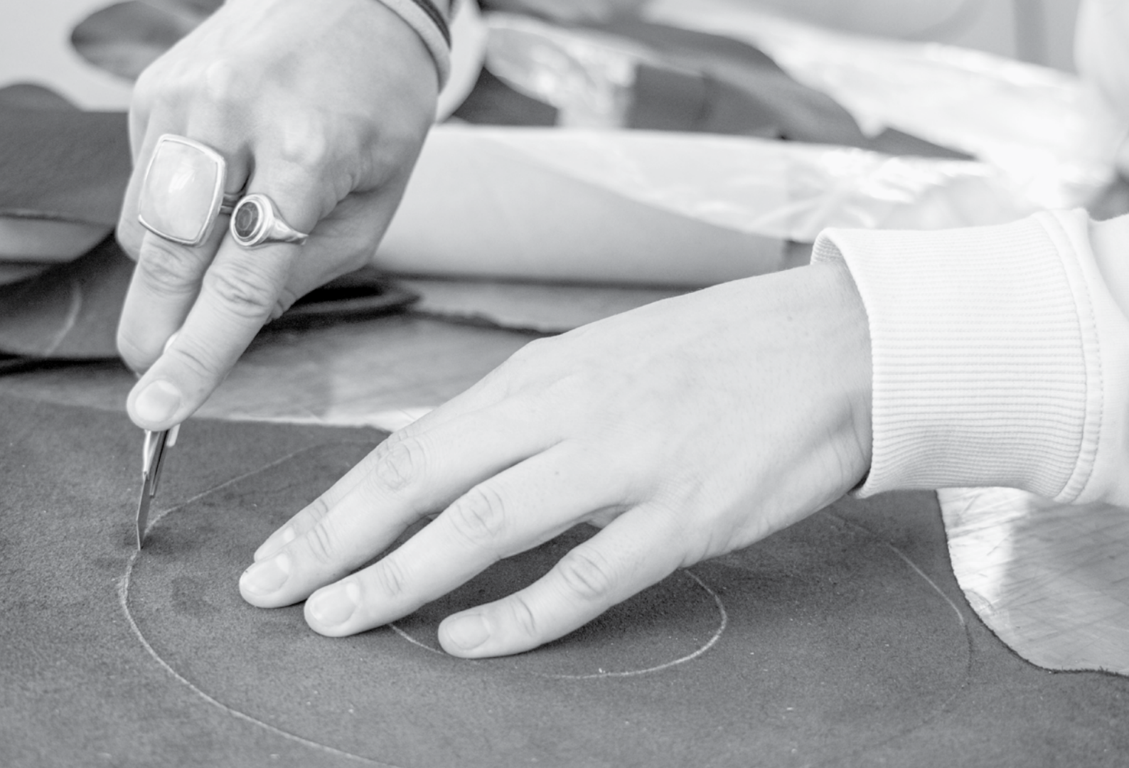
Zuschneiden mit dem Cutter und Schärfen mit der Maschine: Die Lederbearbeitung entsteht in vielteiliger Handarbeit.