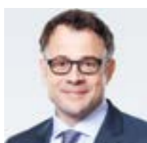
Kaspar Sutter Capo del Dipartimento dell'economia, degli affari sociali e dell'ambiente