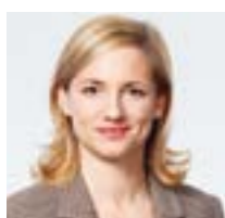
Esther Keller Capo del Dipartimento delle costruzioni e dei trasporti