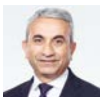
Mustafa Atici Capo del Dipartimento dell'educazione