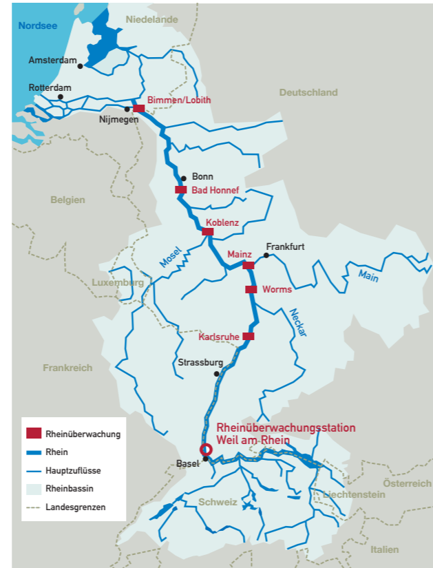
Rhein-Einzugsgebiet und Lage der Überwachungsstationen am Rhein

Sobald die Messungen anzeigen, dass relevante Mengen eines Schadstoffes in den Rhein gelangt sind, löst die RÜS Alarm aus. Regional oder je nach Schwere der Verunreinigung auch international. Bei der Alarmierung geht es in erster Linie darum, die Trinkwasseraufbereitung der Stadt Basel und weiterer, flussabwärts gelegener Wasserwerke zu schützen. Rund 22 Millionen Menschen beziehen ihr Trinkwasser aus dem Rhein. Doch auch Wasserorganismen und ihre Lebensräume müssen geschützt werden. Bei einer Alarmierung wird versucht, möglichst rasch die Ursache der Verunreinigung zu ermitteln, um deren Einleitung in den Rhein zu stoppen.