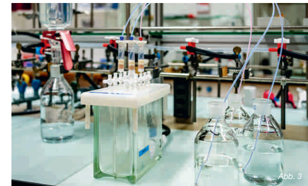
Wasserproben bei der Analyse im Labor