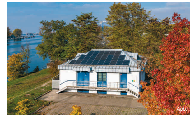
Gebäude der Rheinüberwachungsstation direkt am Rhein