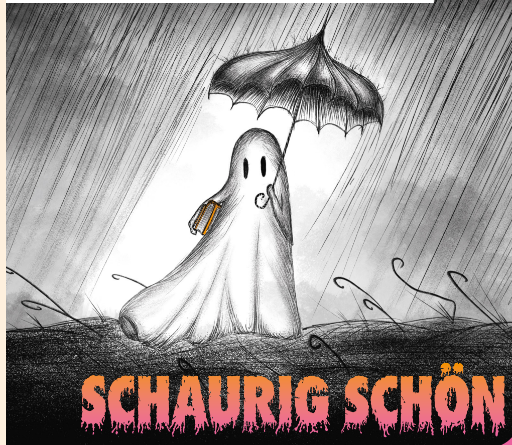
Illustration: Stefan Bachmann

Kooperationspartner: Baobab Books, Bibliothek St. Johann JUKIBU, Kinder- und Jugendmedien Region Basel KJM, Schweizerisches Jugendschriftenwerk SJW